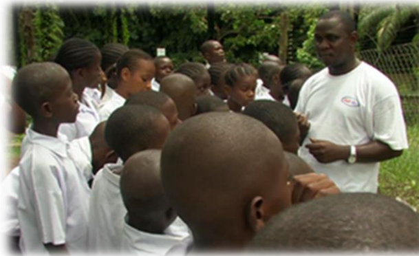
La Conservation Commence par l'éducation