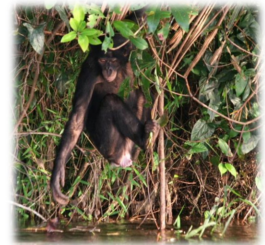
Réintroduction: Ekolo ya bonobo