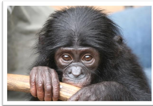
Lubi s'habitue bien à son nouvel environnement