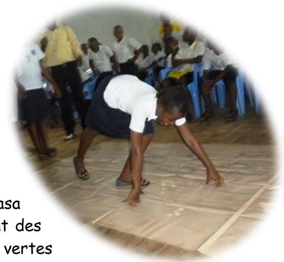
Jeune écolière imitant la marche du bonobo