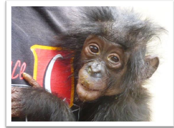
Nos meilleurs efforts n'ont pu sauver Ngaba

Ngaba, male, 4 ans: Le 19 septembre, un Congolais est venu à Lola ya bonobo espérant vendre un bonobo qu'il détenait à Ngaba, un quartier populaire de Kinshasa. Malade et difficile à nourrir, le bonobo lui coûtait. Il n'a pas été trop difficile de le convaincre de nous laisser aller le récupérer. Le bonobo était visiblement déshydraté et souffrait d'une grippe très avancée. Il est mort trois jours plus tard en dépit des meilleurs efforts de notre 'équipe vétérinaire.