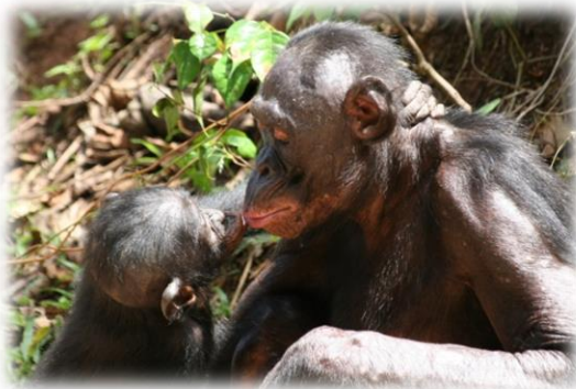
Sauvegarde du bonobo : Saisies & réhabilitation à Lola ya bonobo