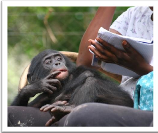
Lopori et sa maman de substitution (octobre 2014)