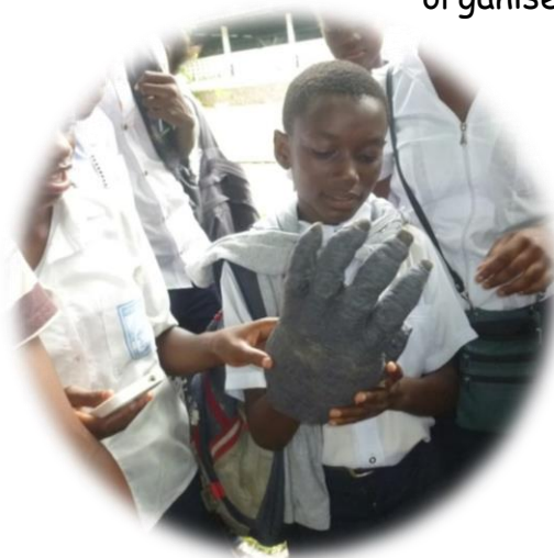
Impressionnés par la main du gorille...

Plus de 25,000 personnes ont été touchées par le programme éducatif de l'ABC à Kinshasa cette année, principalement lors de visites à Lola ya bonobo ! Plus de la moitié étaient des jeunes et des enfants, en particulier dans le cadre de visites éducatives ou de journées vertes organisées avec leurs écoles.